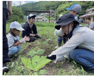
▲おやこ食育クラブ

4日(土) おやこ食育クラブ「土寄せしよう!&炭火焼き鳥作り」 10:30～15:00 昼食あり (事前申込必要) 年間を通して畑で作物を作ったり料理したり... 親子を対象とした食育体験プログラム。 1回参加のほか、お得な複数回セットがあります。 今年第4回目は「土寄せしよう!&炭火焼き鳥作り」! 詳しくはHPで。