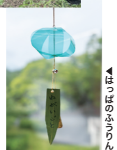
▲はっぱのふうりん

4日(土) はっぱのふうりん(兵教大生WS) ①11:00 ②14:00 各12名 600円 (予約優先) もうすぐ七夕まつり! ささの葉っぱを使って、涼しそうな 風鈴を、兵庫教育大学生と一緒に作ろう! 【60分】