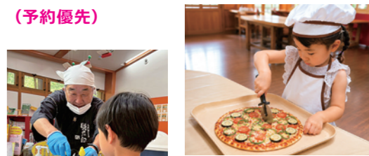
▲あめ細工に チャレンジ!

19日(日) とれたて夏野菜ピザ ①11:00 ②14:00 各8組 3,000円/組 (予約優先) トマトにバジル...ちるみゅーで採れた野菜でピザを焼こう! 【70分】 あめ細工にチャレンジ! ①10:30 ②11:30 ③12:30 ④13:30 ⑤14:30 ⑥15:30 各2名 飴細工お土産付2,000円 (予約優先) 少人数制で、あめ細工職人・飴太郎さんに教わっているんな形の あめ作りに挑戦! ※ハサミの使える方【40分】