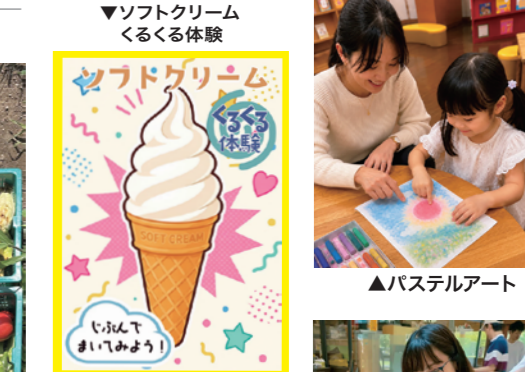
▼ソフトクリーム くるくる体験

22日(水) カンバッジ工房 11:00～16:20(随時) 500円 お絵かきしたり、シールやキラキラを貼ったりしてオリジナルの カンバッジをデザイン! 【30分程度】 ソフトクリームくるくる体験 14:00～17:00随時 夏休み期間(7/22～8/30)の平日限定! テイクアウトカフェにて、自分でソフトクリームを巻いてみよう!