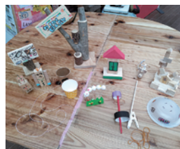
▲わくわく図工屋台 (内容は月によって変わります)

わくわく図工屋台 14:00~15:30随時(受付は15時まで) 500円(チケット5枚) ボランティアさんのいろいろな工作ブースが大集合。 コマ回し・木工・レザークラフトなどをチケットで体験しよう!