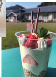
▲母の日いちごパフェ

10日(日) 母の日いちごパフェ 10:30~12:00(随時) 15名(お一人1個) 1,200円/個 (予約優先) 今が旬のいちごや、クリーム、グラノーラなどを透明カップに重ねて、見た目もかわいい春のパフェをつくろう!