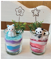
▲カラーサンドメモクリップ

9日(土) おやこ食育クラブ「田植え」 10:30~15:00 昼食あり (事前申込必要) 年間を通して畑で作物を作ったり料理したり…親子を対象とした食育体験プログラム。 1回参加のほか、お得な複数回セットがあります。 今年第2回目の内容は「田植え」! 詳しくはHPで。