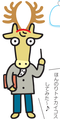
ほんのりトナカイユニス しるみゅー