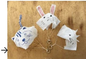
パラシュートづくり→