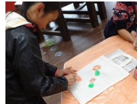
スタンピング マイバッグ ←