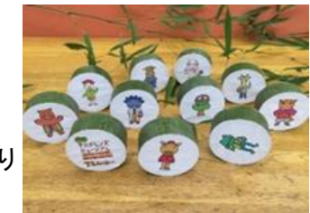
竹の おきあがり こぼし→