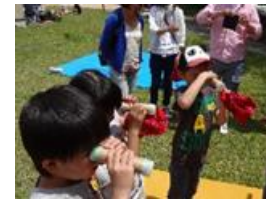
しぜんの万華鏡作り ←